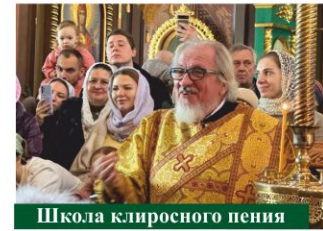
Школа клиросного пения

25 января 2024 года в Свято-Троицком соборе г. Краснодара стартовала школа клиросного пения под управлением клирика Свято-Троицкого собора протоиерея Михаила Околот. Встречи будут проходить каждую неделю в четверг в 18:30 в приделе в честь святителя Спиридона Тримифунтского.