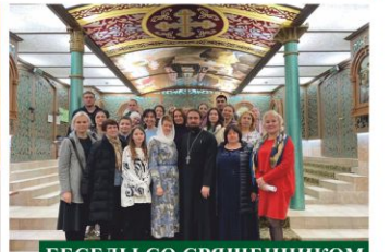
БЕСЕДЫ СО СВЯЩЕННИКОМ

Каждую среду в 18:30 в приделе в честь святителя Спиридона Тримифунтского проходят встречи со священником, на которых обсуждаются актуальные темы годового богослужебного цикла.