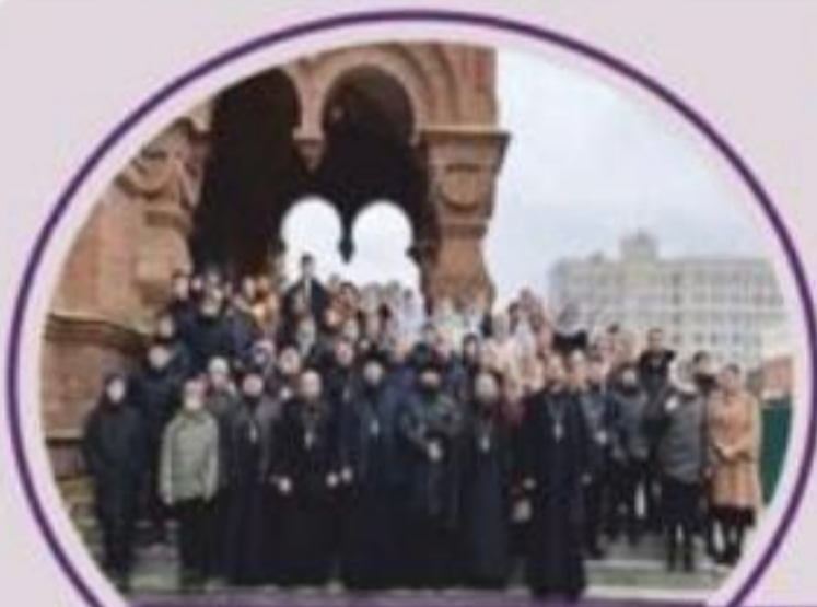
Экскурсия по Собору для детей священнослужителей Екатеринодарской епархии