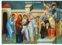
4 декабря – Введение во храм Пресвятой Богородицы.

Когда Деве Марии исполнилось три года, ее родители Иоаким и Анна, как и обещали, привели дочь в храм, чтобы посвятить своего ребенка служению Богу. Традиция эта была достаточно распространенной в израильском обществе. Супруги, у которых, так же как и у родителей Богородицы, ребенок рождался уже в преклонном возрасте, посвящали свое дитя Богу, отдавая в храм. Таким образом они выражали свою благодарность Творцу, а дети получали должное воспитание и образование, а когда подрастали – помогали восстанавливать храм, пострадавший при осаде Иерусалима римлянами. По преданию, сама Богородица участвовала в вышивке завесы для Святой святых – той самой, которая в момент смерти ее Сына на Кресте раздралась надвое (Мф 27:51). Маленькая Мария без посторонней помощи поднялась по 12 ступеням, которые символизировали 12 колена (то есть родов) Израилевых. Ее встретил первосвященник Захария, будущий отец пророка Иоанна Предтечи. Почему же Церковь так выделяет это событие? Потому что в храм, который для иудейского народа был местом особого присутствия Божия, вошел новый, уже одушевленный храм Божий – Богородица, – из которого в мир придет Сам Христос.