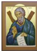
13 декабря – память апостола Андрея Первозванного (ок. 62)

Святая Екатерина жила на рубеже III и IV веков и принадлежала к царскому роду. По преданию, она обладала редким умом и была необычайно красива. Девушка получила хорошее образование – с юных лет Екатерина интересовалась трудами античных ученых и философов. Чтобы устроить жизнь девушки и преумножить богатство, родители хотели как можно скорее выдать свою дочь замуж за достойного мужчину. Однако Екатерина отказалась от будущего, уготованного ей отцом и матерью. Девушка приняла христианство и решила посвятить свою жизнь служению Богу. Но за свою веру и преданность Господу Екатерина и пострадала. В то время в Александрию прибыл император Максимиан. В его честь во дворце устроили языческое празднество с человеческими жертвоприношениями. Не выдержав такой жестокости, Екатерина призвала правителя и весь народ отказаться от идолов и принять христианство. Тогда взбешенный император велел ее колесовать, но как только девушку привели на казнь, явился Ангел и сокрушил орудие пыток. Увидевшие это чудо своими глазами перед всеми исповедали христианскую веру, за что были обезглавлены. Максимиан безжалостно расправился не только с приближенными, но и со своей женой, императрицей Августой. Вслед за ними обезглавили и святую Екатерину. Ее мощи были перенесены ангелами на Синайскую гору.