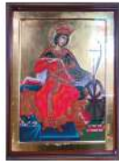
7 декабря – память великомученицы Екатерины (305-313)

Неустрашимый защитник своего отечества, премудрый полководец-победитель, тонкий дипломат и искусный правитель, и вместе с тем благочестивый христианин и смиренный молитвенник, сподобившийся перед кончиною великого ангельского образа, – так предстает перед нами образ святого русского князя, широко прославленного и в церковной, и в светской среде. В 22 году Александр Невский уже выиграл свои главные битвы, но прославился он не только этим. Князь остановил вторжение шведов и немцев, добился частичной независимости Руси от Орды. Ни восток, ни запад так и не «съели» Русь до конца, в итоге она вновь обрела независимость. Все дела – и ратные, и политические – он привык вести с постоянной оглядкой на Небеса, говоря: « Не в силе Бог, а в правде ». Благоверный Александр Невский – « солнце земли Русской ». Именно так: «Закатилось солнце» – сказал митрополит Кирилл в 1263 году на погребении святого князя во Владимире, а люди в ответ воскликнули: « Уже погибаем! ».