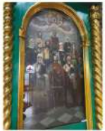
6 декабря – память благоверного, великого князя Александра Невского (в схиме Алексия) (1263)

Когда Деве Марии исполнилось три года, ее родители Иоаким и Анна, как и обещали, привели дочь в храм, чтобы посвятить своего ребенка служению Богу. Традиция эта была достаточно распространенной в израильском обществе. Супруги, у которых, так же как и у родителей Богородицы, ребенок рождался уже в преклонном возрасте, посвящали свое дитя Богу, отдавая в храм. Таким образом они выражали свою благодарность Творцу, а дети получали должное воспитание и образование, а когда подрастали – помогали восстанавливать храм, пострадавший при осаде Иерусалима римлянами. По преданию, сама Богородица участвовала в вышивке завесы для Святой святых – той самой, которая в момент смерти ее Сына на Кресте раздралась надвое (Мф 27:51). Маленькая Мария без посторонней помощи поднялась по 12 ступеням, которые символизировали 12 колена (то есть родов) Израилевых. Ее встретил первосвященник Захария, будущий отец пророка Иоанна Предтечи. Почему же Церковь так выделяет это событие? Потому что в храм, который для иудейского народа был местом особого присутствия Божия, вошел новый, уже одушевленный храм Божий – Богородица, – из которого в мир придет Сам Христос.