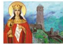
17 декабря – память великомученицы Варвары

на учеников Святого Духа в день Пятидесятницы апостолы бросили жребий, кому куда идти с проповедью Евангелия. Андрею выпало Причерноморье. Проповедь апостола о воскресшем Спасителе мира обращала ко Христу города и целые языческие племена. Апостол Андрей исцелял недужных и даже воскрешал умерших. Однажды он воскресил сорок человек, которые спешили к нему услышать весть о Христе, но погибли во время жестокого шторма. С этим случаем связано почитание апостола как покровителя моряков. Апостол Андрей не раз подвергался преследованиям от язычников и городских властей. Последним местом, где звучала его проповедь, стал греческий город Патры. Правитель города, видя, как много людей обращается к новой вере, приказал распять Андрея на кресте в виде буквы Х. Два дня апостол с креста проповедовал Евангелие. Исцеленная апостолом жена правителя с честью погребла его тело.